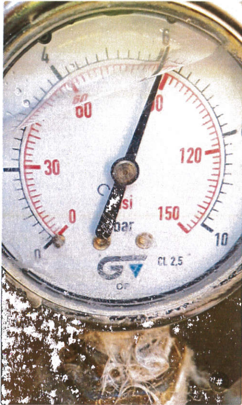
20211021_120942.jpg 4,35 MB 2268x4032 /Memoria interna/DCIM/Camera