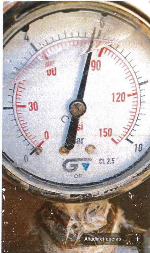
20211021_131452.jpg 6,50 MB 2268x4032 /Memoria interna/DCIM/Camera