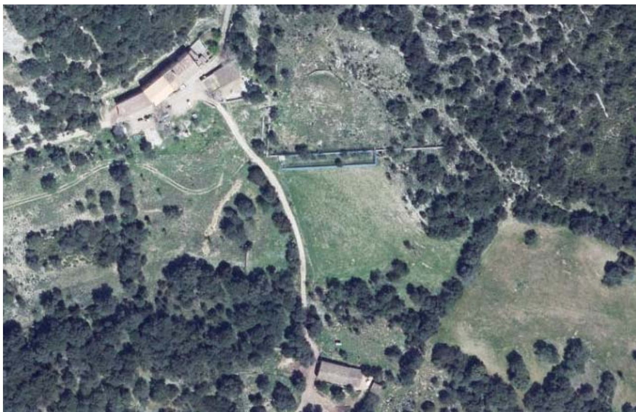
Ortofoto del 2015