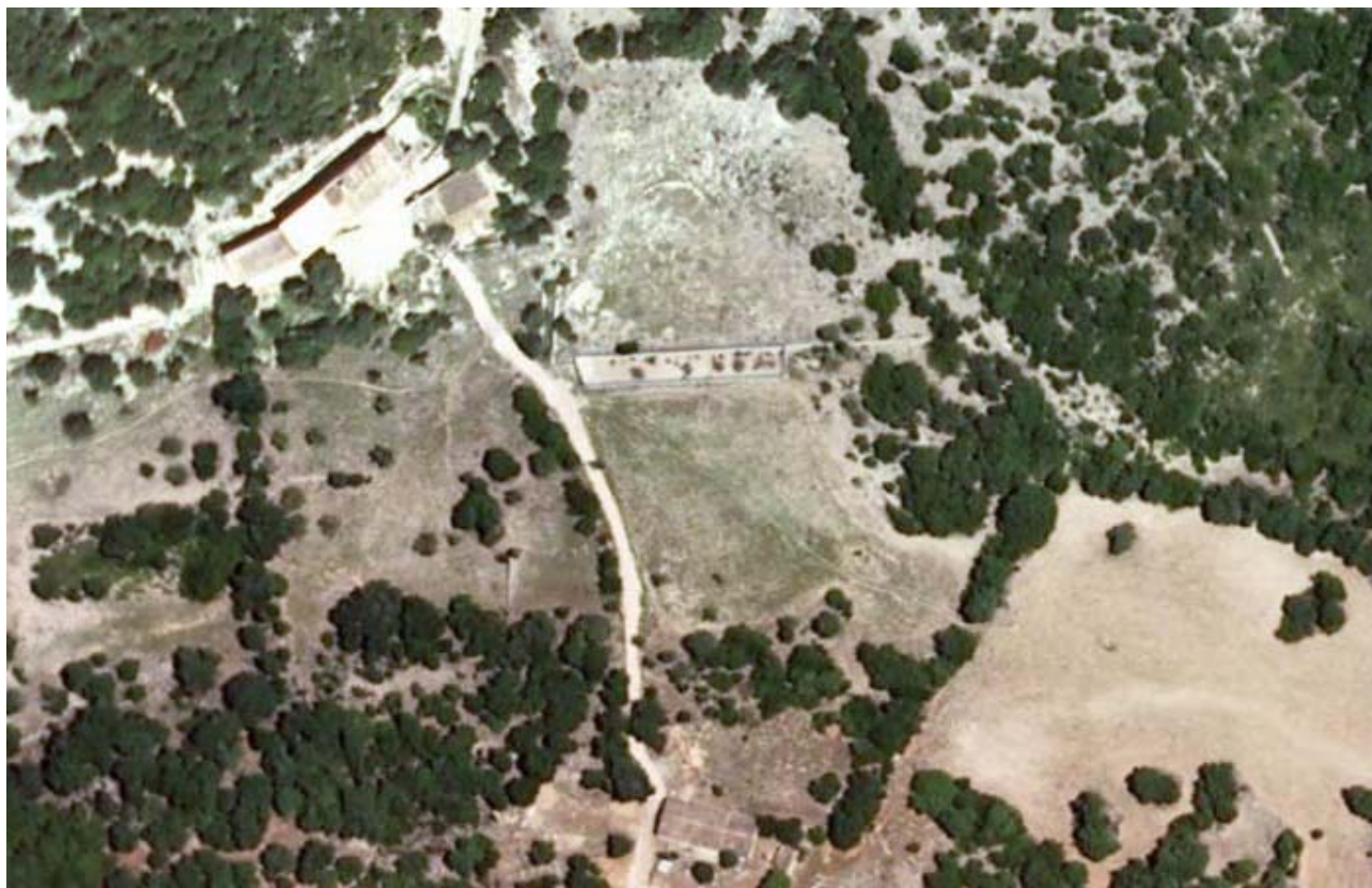
Ortofoto del 2008