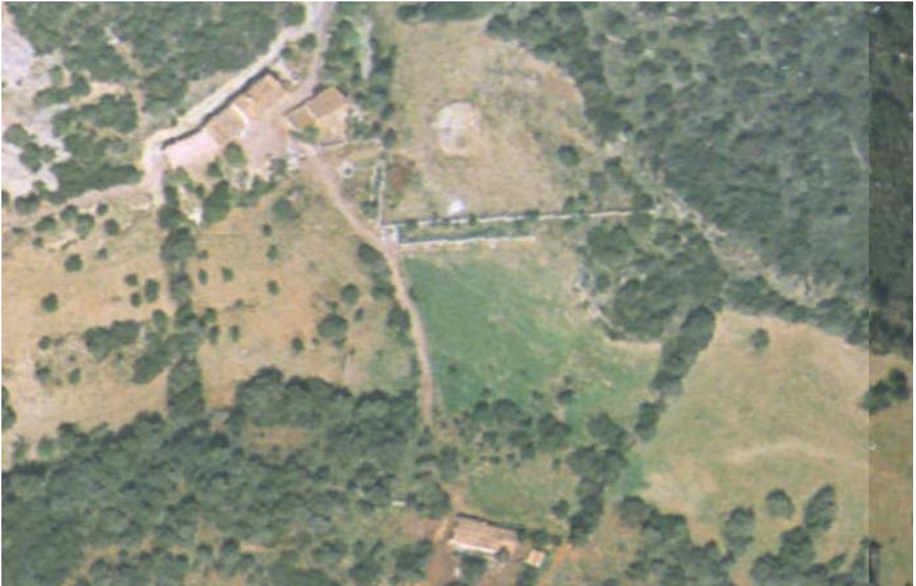
Ortofoto del 2001