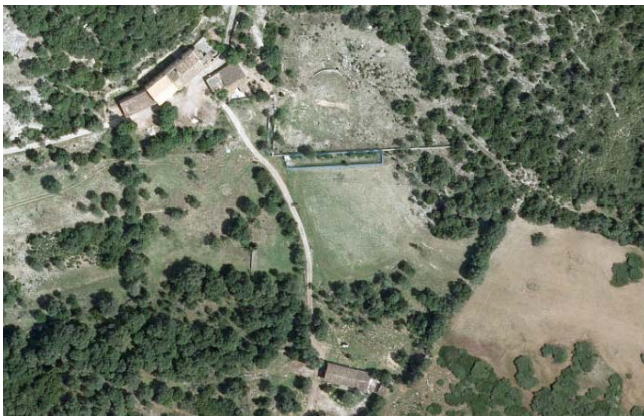
Ortofoto del 2012