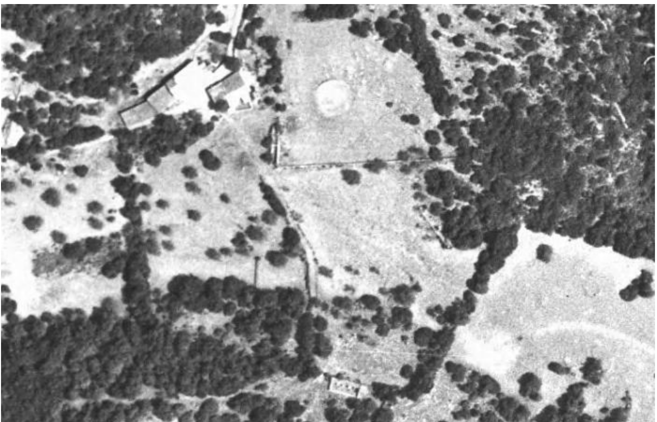
Ortofoto de 1989