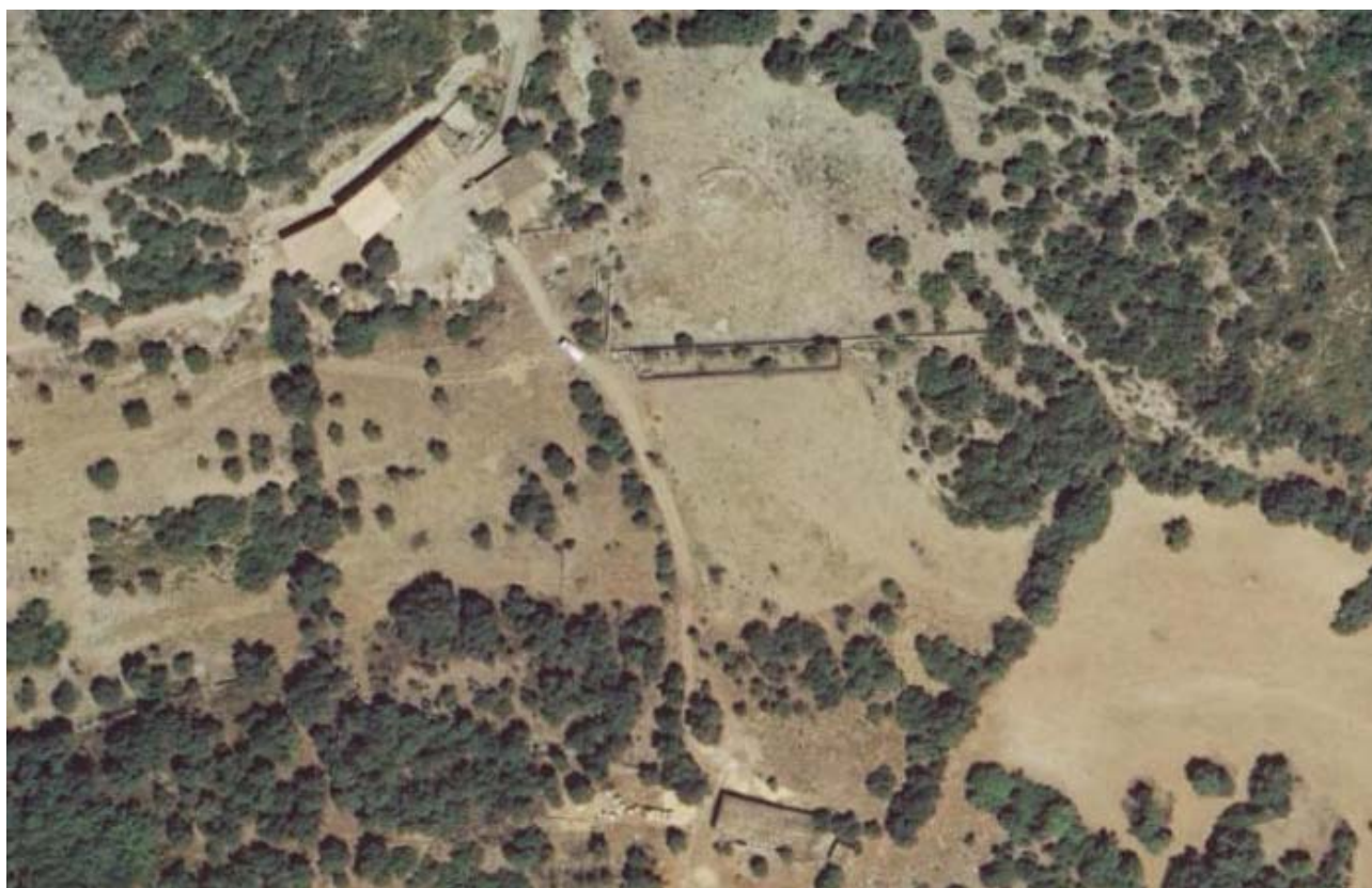
Ortofoto del 2006