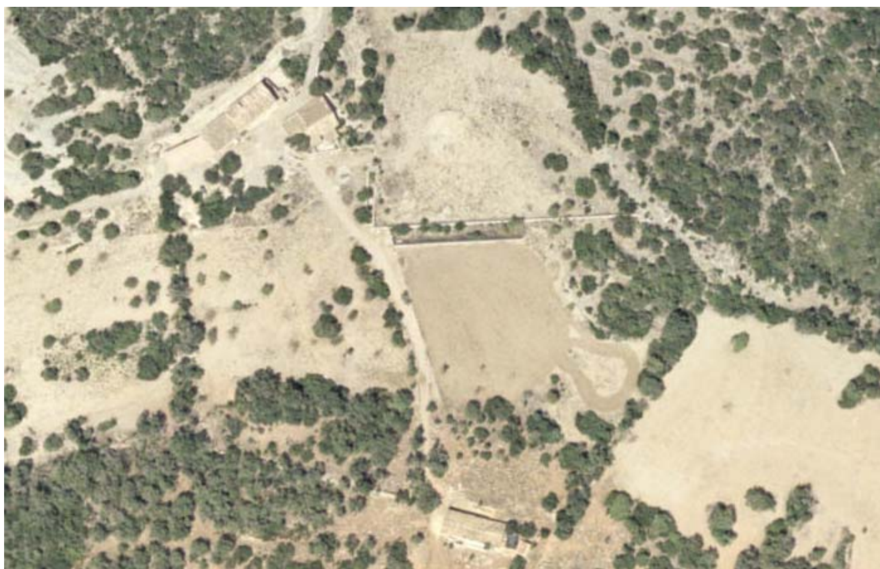
Ortofoto del 2002