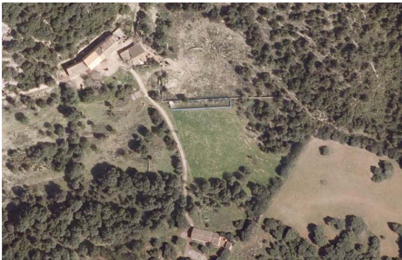
Ortofoto del 2010