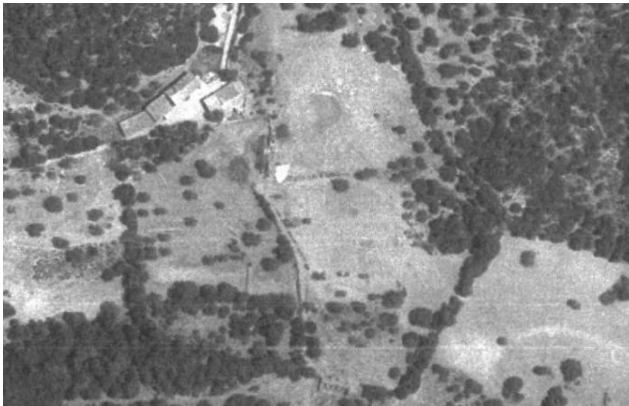
Ortofoto de 1984